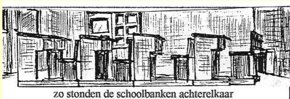
zo stonden de schoolbanken achterelkaar