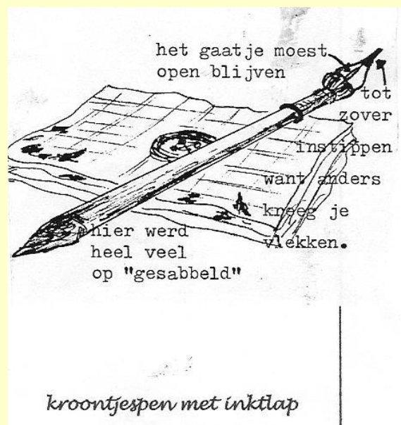
kroontjespen met inktlap