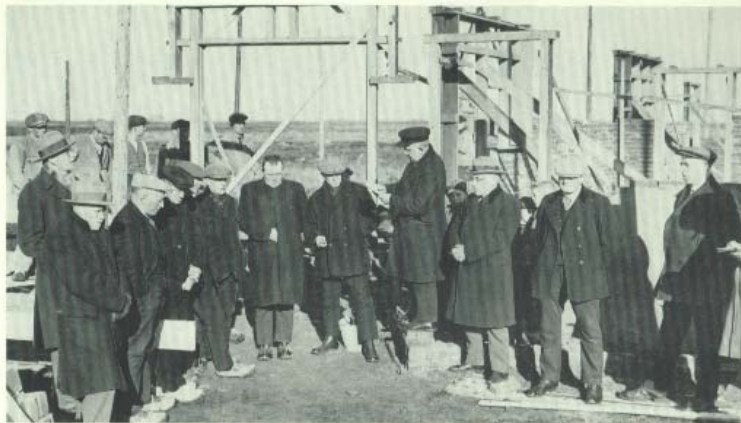
1e steenlegging op 4 maart 1931 door B. v.d. Zwaag.

Op school heeft ook de ouderparticipatie haar intrede gaan. Veel moeders werken mee met handwerken, lezen en gymnastiek. Ook worden er projecten behandeld als "De mens en zijn hobby".